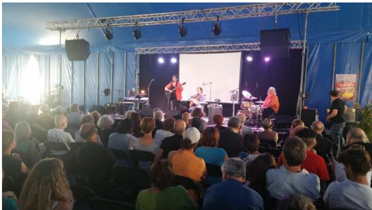
Fête de l'Humanité 2018